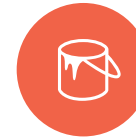
Maling, syrer, lakk og lim