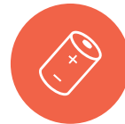
Alle typer batterier