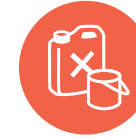
Spraybokser og gass