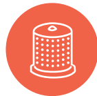
Bil- og båtprodukter