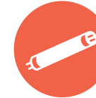
Lysstoffrør, sparepærer, halogenpærer og vanlige lyspærer